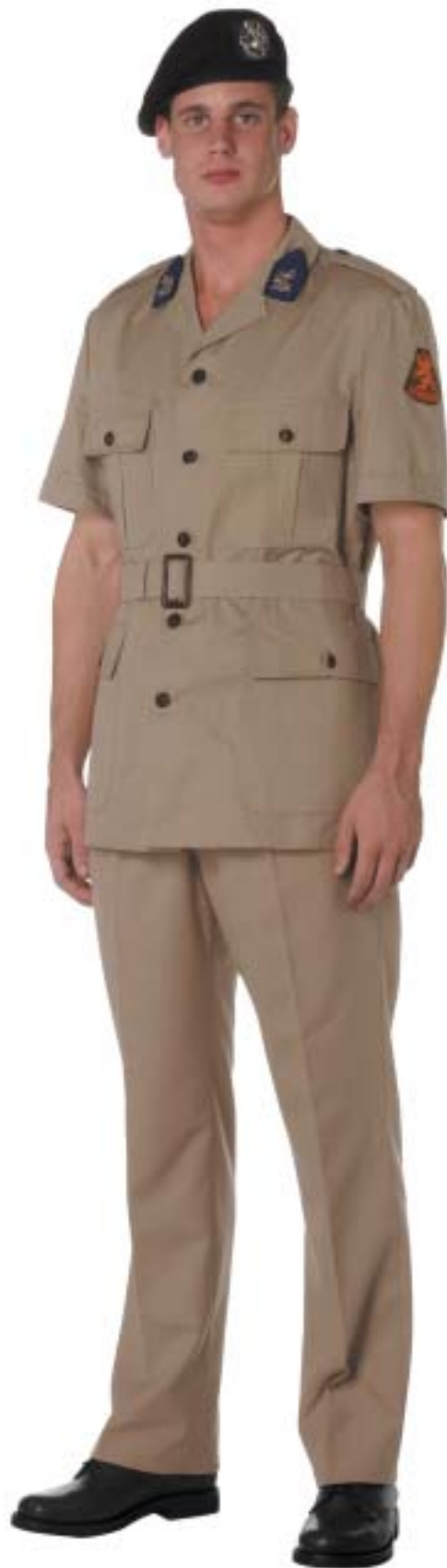
Kazernetenuen Tropen (KTT)