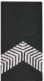
Korporaal (cav, ma)