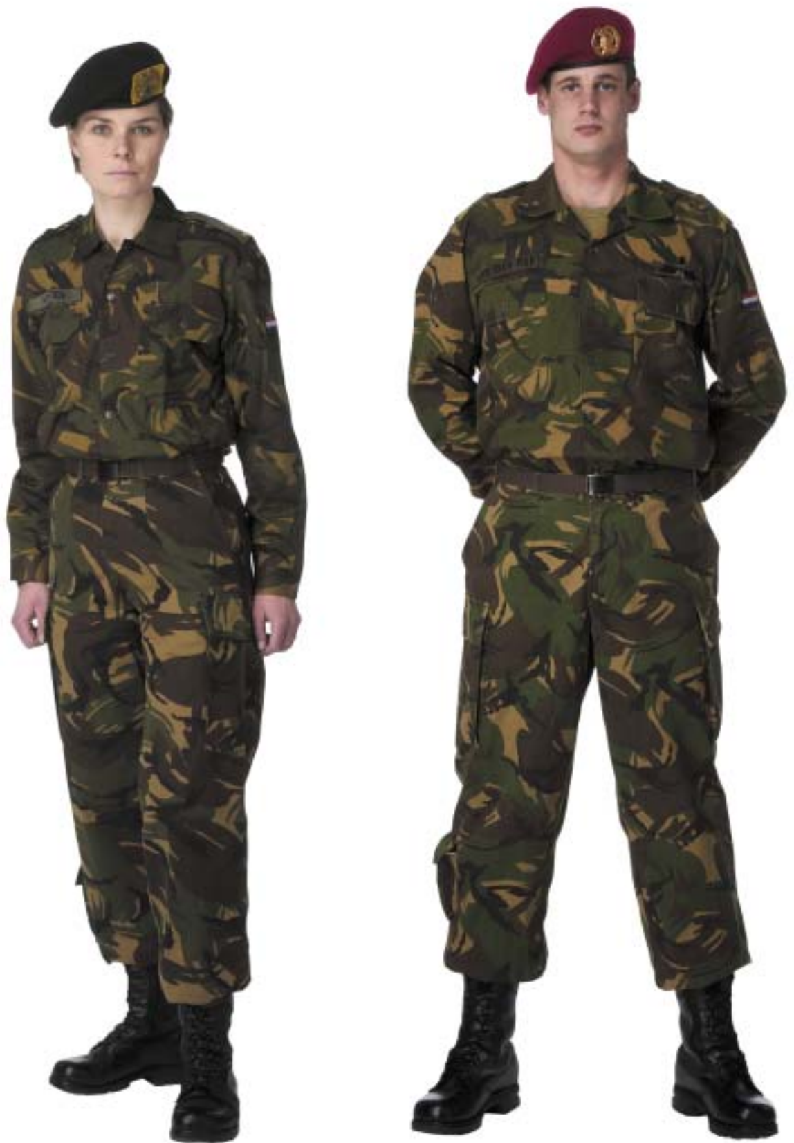
Gevechtstenue (GVT) met overhemd