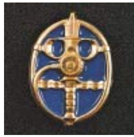
Instructeur GVA duiken