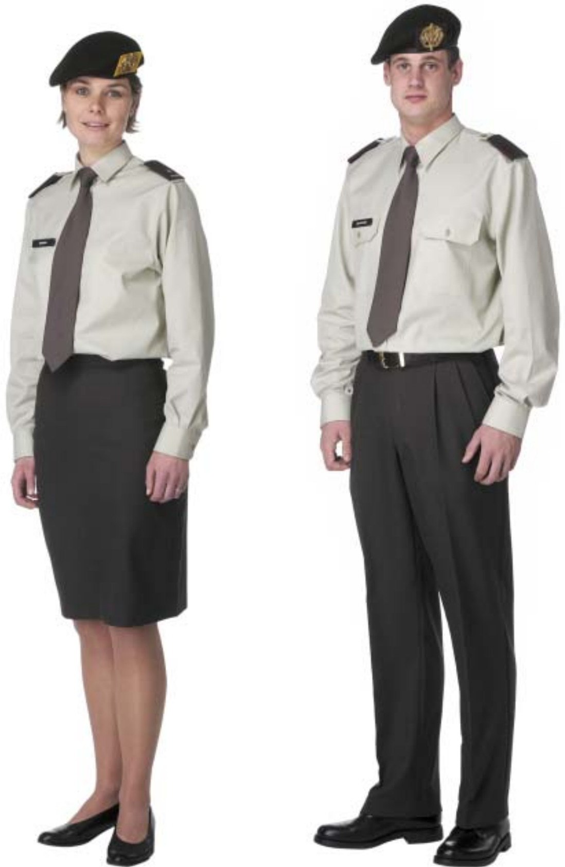
Dagelijks Tenue (DT) zonder jas met overhemd lange mouw