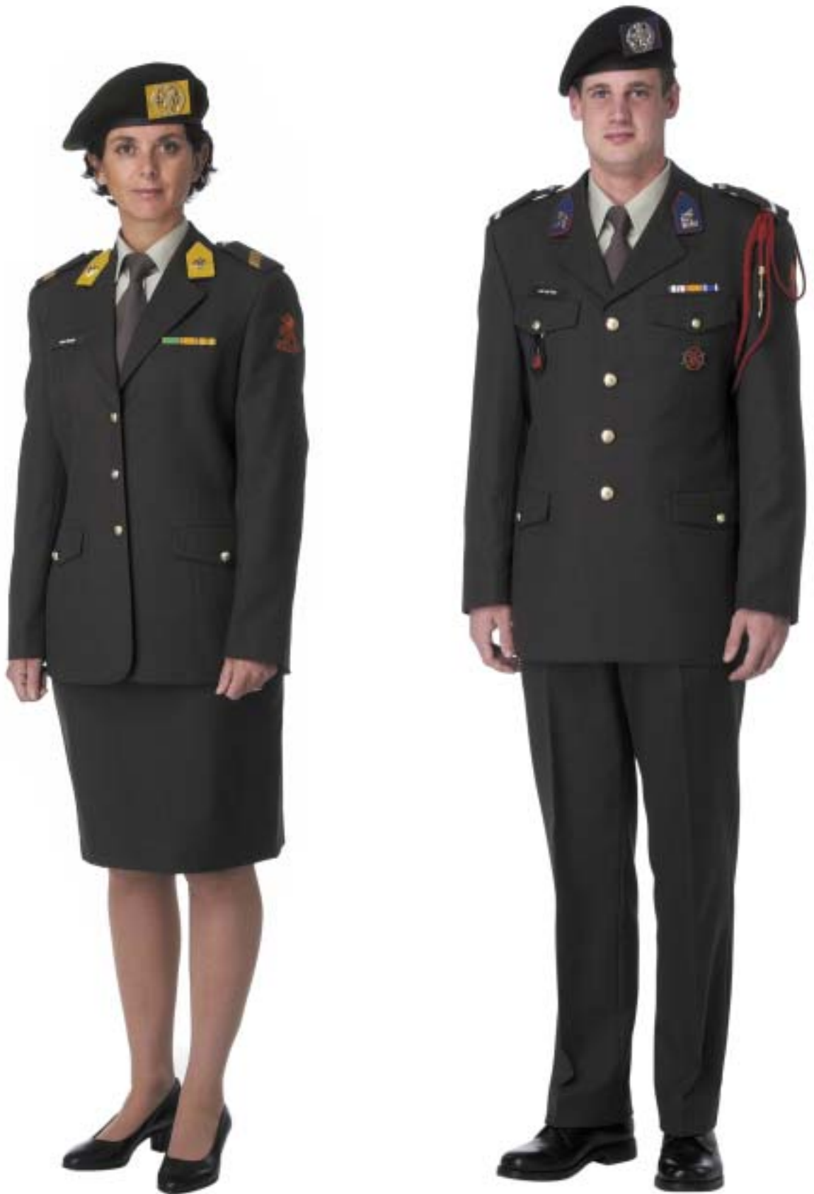
Dagelijks Tenue (DT) met jas en broek / rok