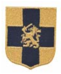
Inspecteur Generaal Krijgsmacht