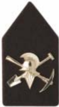
Wapen der Genie, pioniers