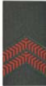
Soldaat der 1 e klasse