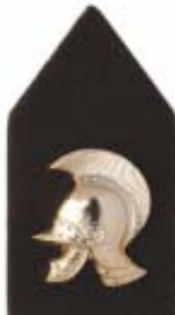
Wapen der Genie, algemeen