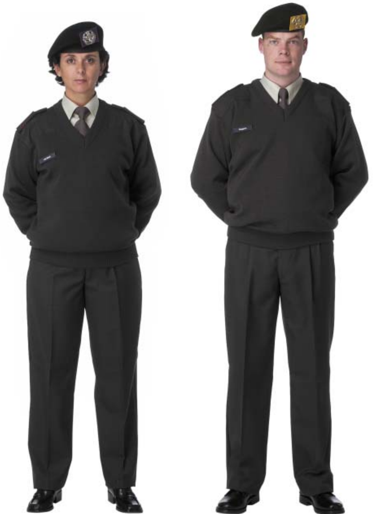
Dagelijks Tenue (DT) zonder jas met trui