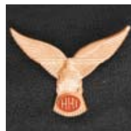
Heli Handling Instructor