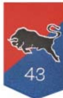
43 Gemechaniseerde brigade