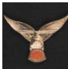
Landing Point Commander