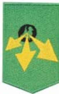
Divisie Logistiek Commando