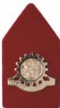
Dienstvak Technische Staf