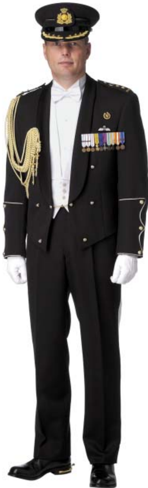
Adjutant van H.M. de Koningin in groot AT