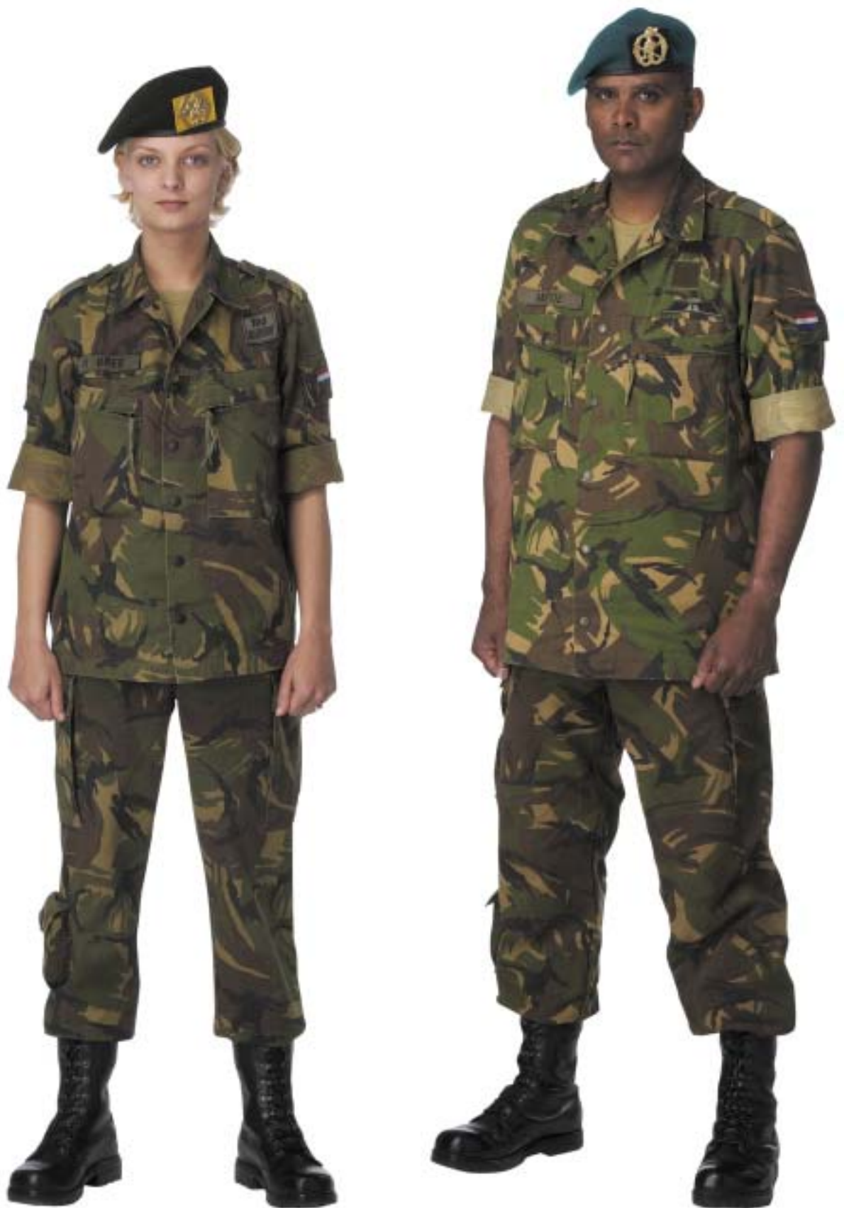
Gevechtstenue (GVT) met basisjas en opgerolde mouwen