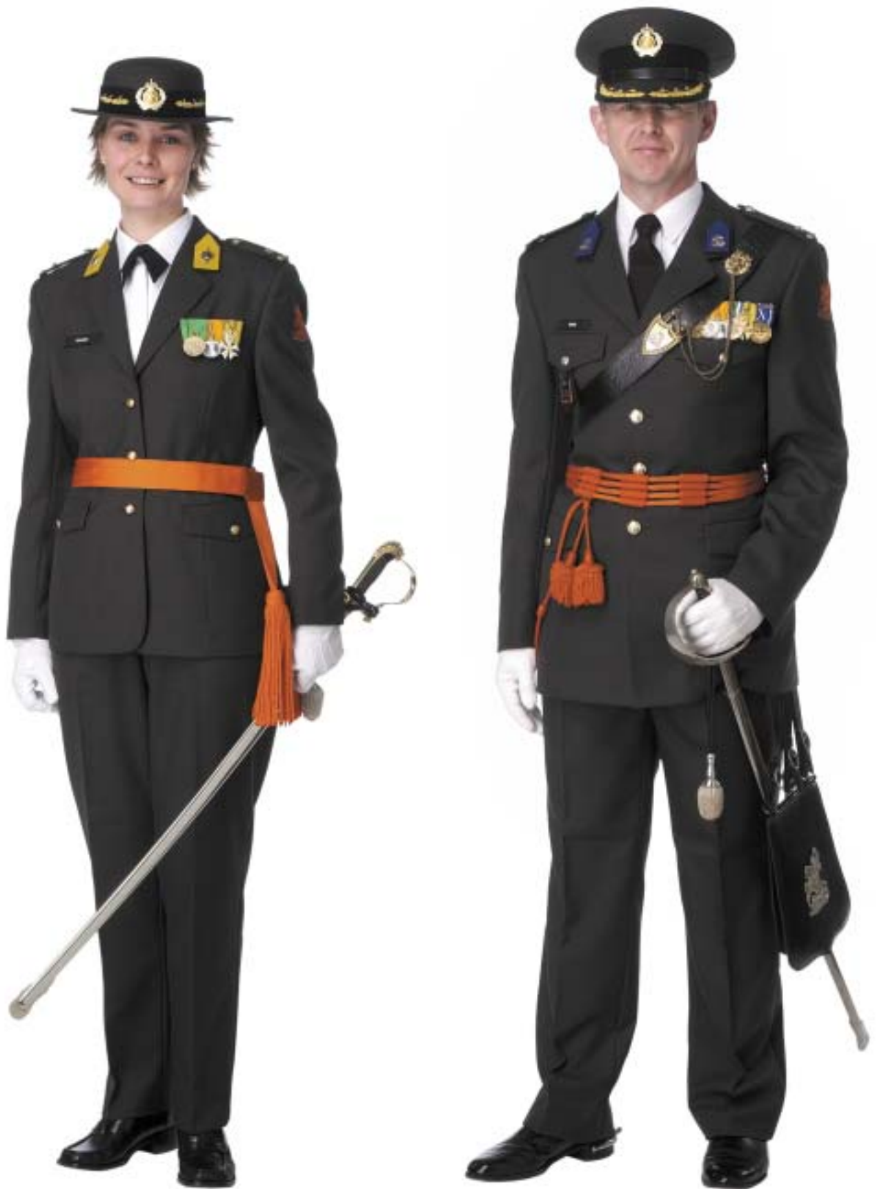
Gelegenheidstenu (GLT) met giberne, sabel en oranje koord- / bandsjerp