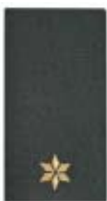
2 e Luitenant