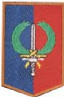
Divisie Gevechtssteun Commando