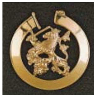
Militair juridisch brevet