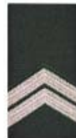
Opperwachtmeester (cav)/ Sergeant-majoor (ma)