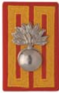
Garderegiment Grenadiers en Jagers (grenadiers) Koninklijke Militaire Kapel