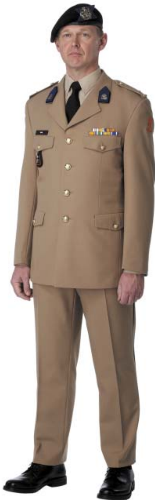
Dagelijks Tenue Tropen (DTT)