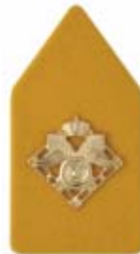
Regiment Bevoorrading- en Transporttroepen