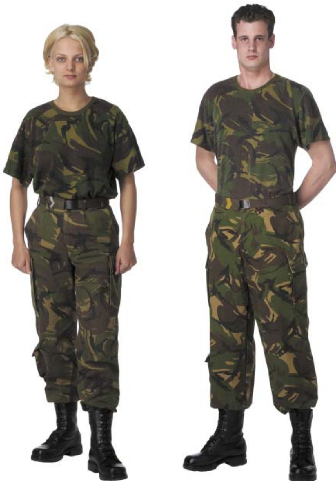
Gevechtstenue (GVT) met t-shirt, (ROT op broekriem)