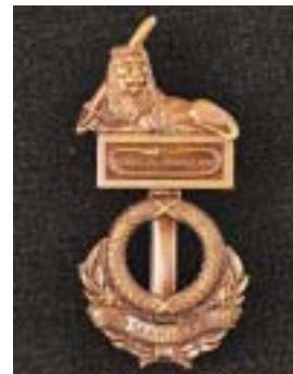
Draagspeld bij groepswaardering