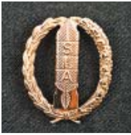
Schutter lange afstand