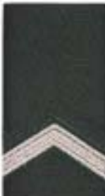
Wachtmeester (cav)/ Sergeant (ma)