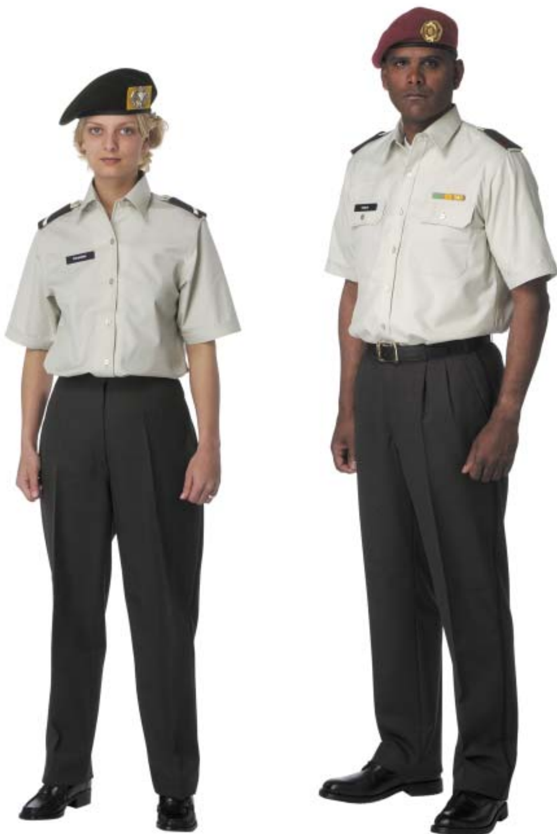
Dagelijks Tenue (DT) zonder jas met overhemd korte mouw