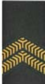
Korporaal der 1 e klasse