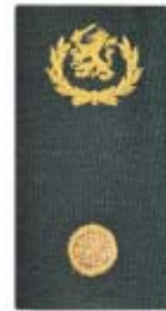
Stafadjutant (Ressortniveau en hoger) Ressortadjutant Landmachtadjutant Krijgsmachtadjutant (indien KL)