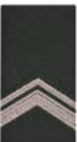
Wachtmeester der 1 e klasse (cav) Sergeant der 1 e klasse (ma)