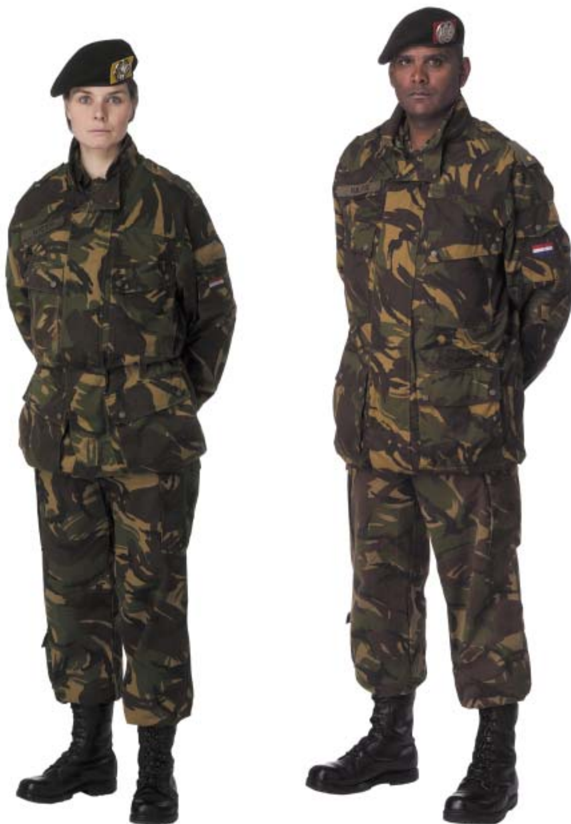
Gevechtstenu (GVT) met parka