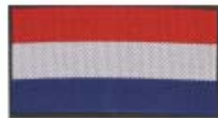
Mouwembleem van de Nederlandse driekleur