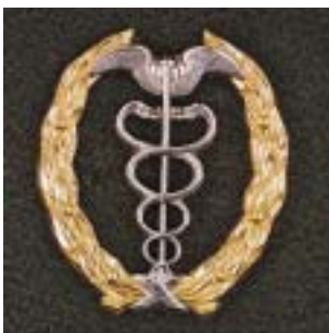
Hogere economische vorming