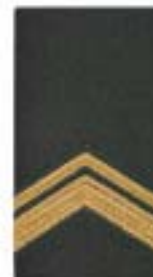
Sergeant der 1 e klasse Wachtmeester der 1 e klasse (art, lua)