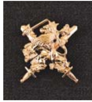
Hogere bekwaamheid militaire LO/Sport