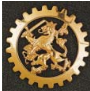
Hogere technische bekwaamheid