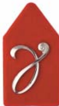
Dienstvak Militair- Psychologische en Sociologische Dienst