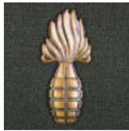
Buitengewoon geoefend handgranaat werpen