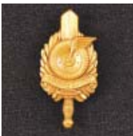
Militaire 24-uurs rit