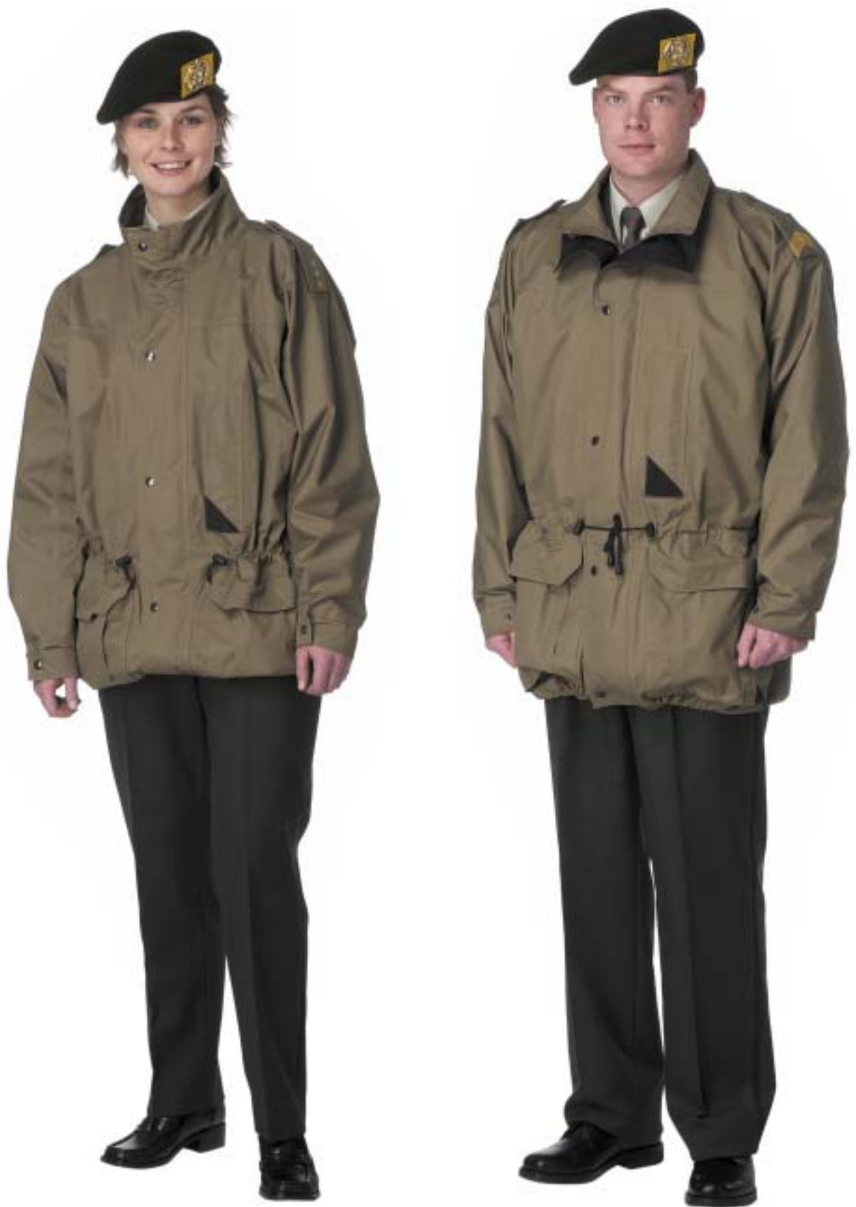
Dagelijks Tenue (DT) met parka