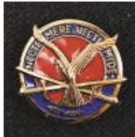
Embleem ex-luchtmobiele brigade