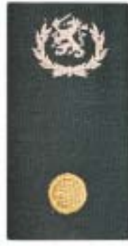
Stafadjutant (RVE niveau) Brigade-adjutant OC-adjutant RMC-adjutant