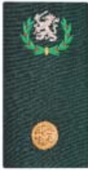
Stafadjutant (RVE-1-niveau) Bataljonsadjutant PC KMS Schooladjutant Cie-adjutant Hrscie