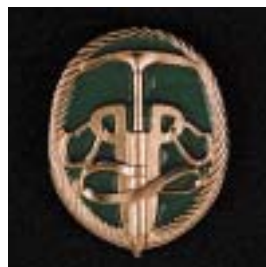
Instructeur werken op hoogte