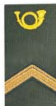
Lid Cadettentamboerkorps Prins Bernhard