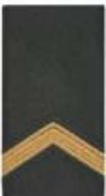
Sergeant Wachtmeester (art, lua)