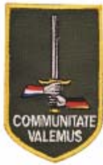
1 (GE/NL) Corps