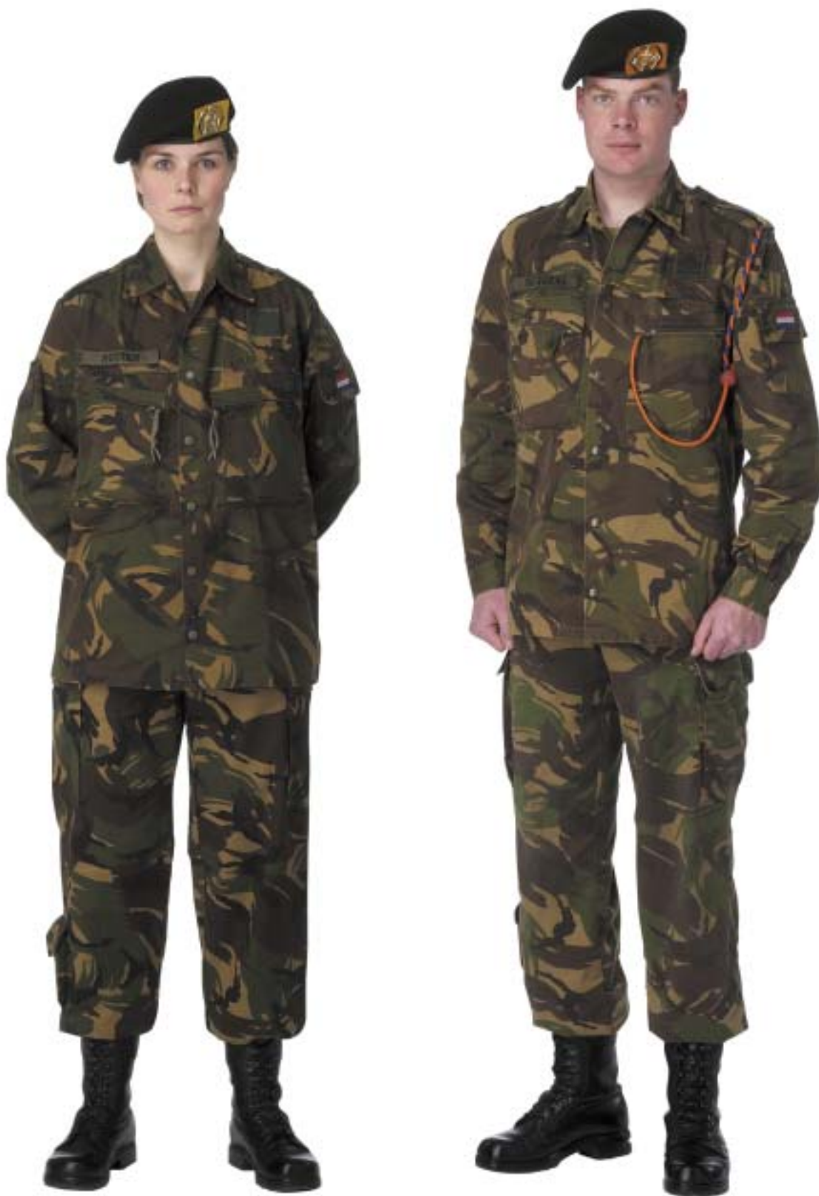
Gevechtstenue (GVT) met basisjas