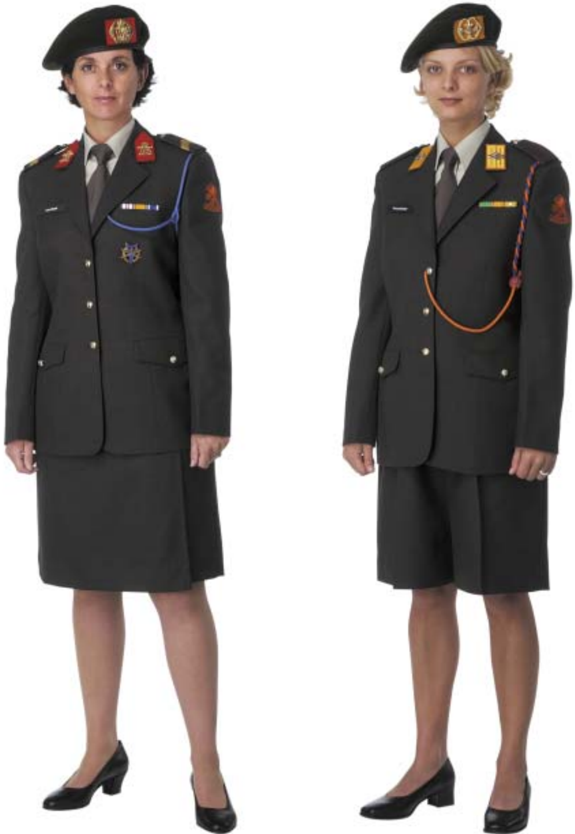
Dagelijks Tenue (DT) met broekrok