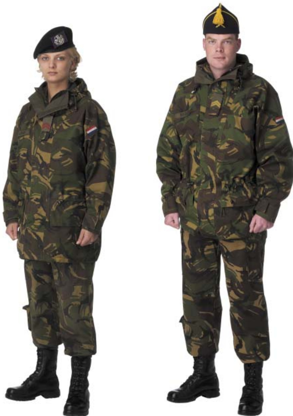
Gevechtstenu (GVT) met parka bilaminaat