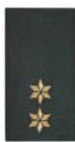
1 e Luitenant