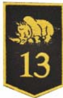
13 Gemechaniseerde brigade