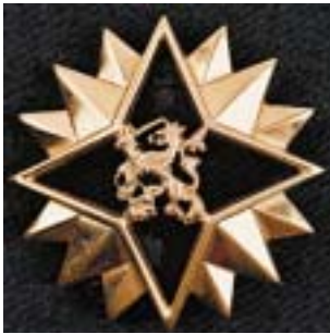
Hogere militaire vorming