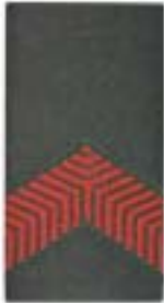
Soldaat der 2 e klasse

De rangonderscheidingstekens (ROTn) worden met uitzondering van het t-shirt en de parka bilaminaat rechtstreeks op de epaulet of als schuifpassant gedragen. Indien het t-shirt wordt gedragen, wordt het ROT aan de broekriem bevestigd. Bij de parka bilaminaat wordt aan de voorzijde één ROT gedragen.