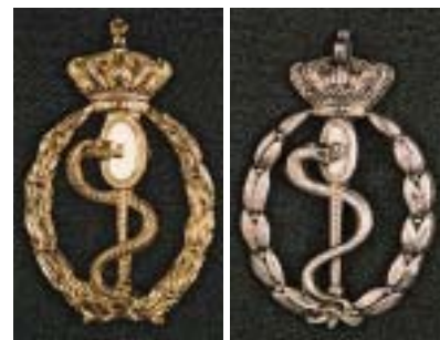
Militair geneeskundige bekwaamheid 1) goudkleurig: arts 2) zilverkleurig: tandarts