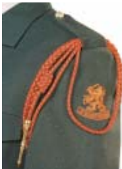
Gouden erekoord (behorende bij de Bronzen soldaat)