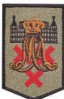
Koninklijke Militaire Academie