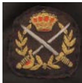
Meester op één of meer wapens