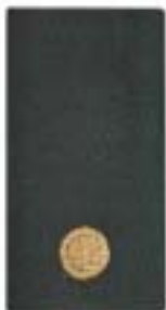
Adjutant / Vaandrig / Kornet (cav, art, lua)