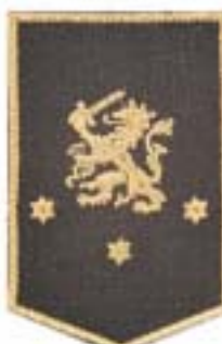
Stafgroep Bevelhebber der Landstrijdkrachten