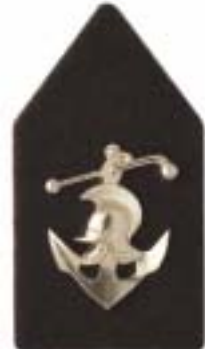
Wapen der Genie, pontonniers