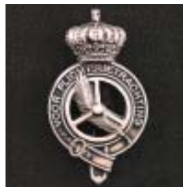
Uitmuntend motorvoertuig bestuurder