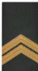
Sergeant-majoor Opperwachtmeester(art, lua)