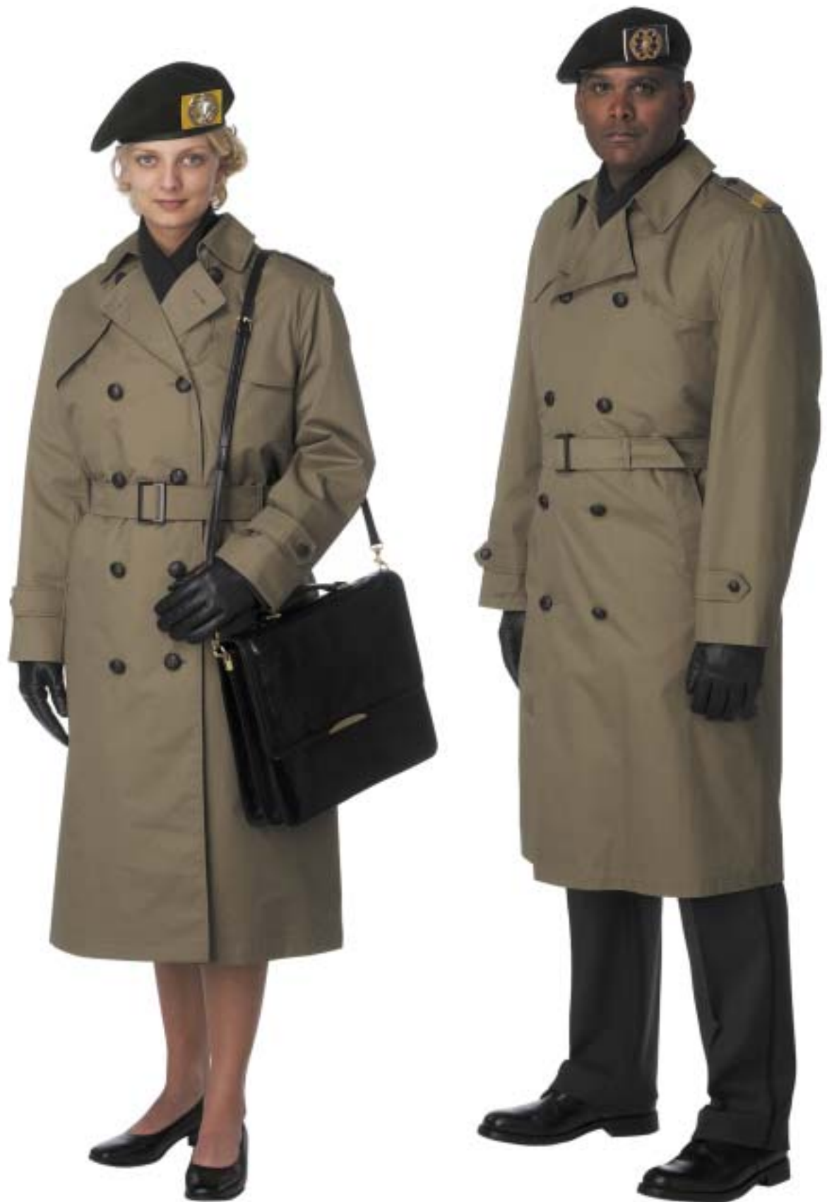
Dagelijks Tenue (DT) met regenjas en sjaal