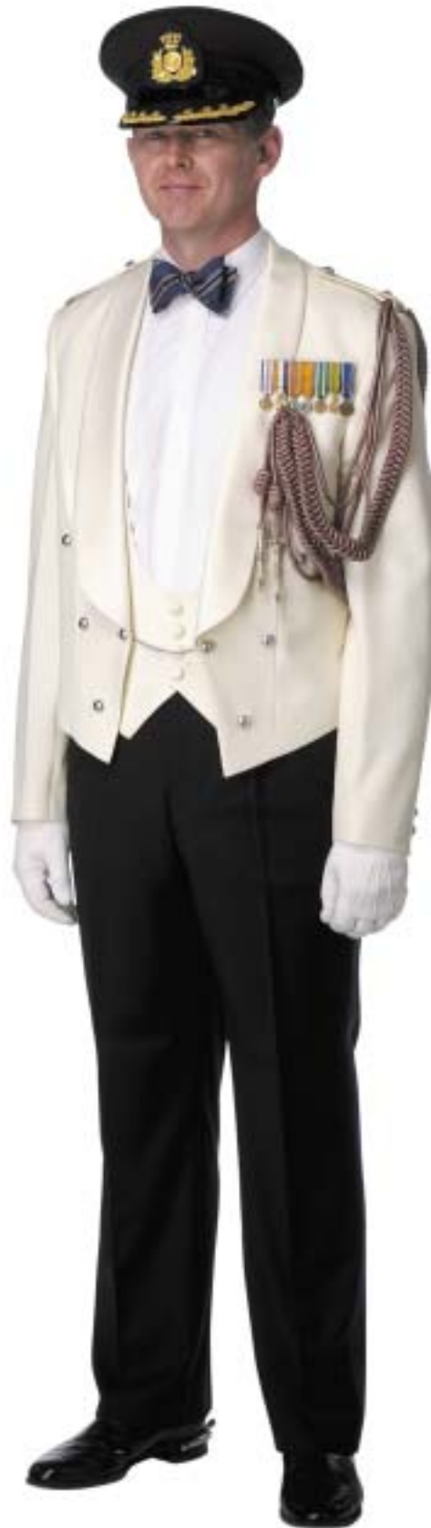
Adjutant BLS in Avondtenue Tropen (ATT)