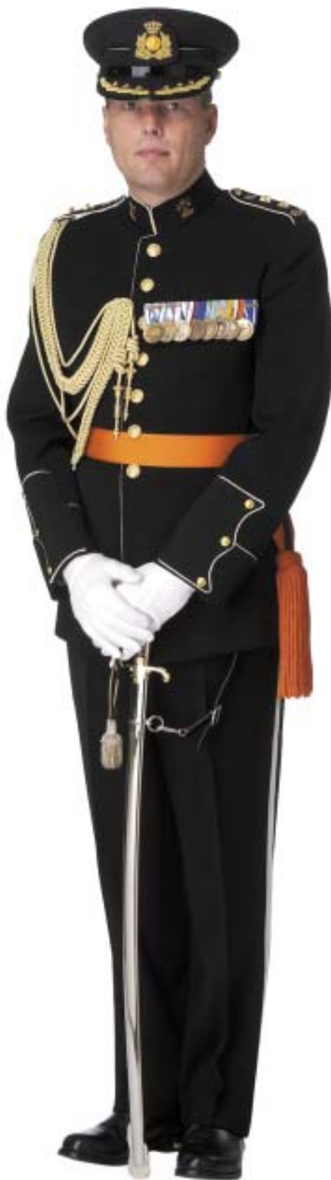
Adjutant van H.M. de Koningin in het Bijzondere Ceremoniële Tenue (BCT)