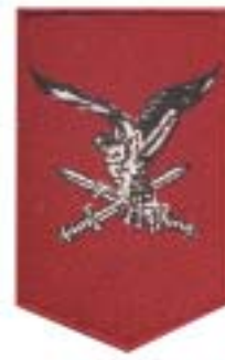
11 Luchtmobiele brigade