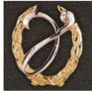
Hogere gedragswetenschappelijke vorming