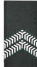
Korporaal der 1 e klasse (cav, ma)