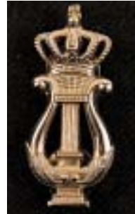
(oud) militair dirigent, kapelmeester

1) zilverkleurig: in bezit van diploma 1e fase HAFABRA